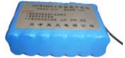
71CR1865-2锂离子电池组充放电曲线