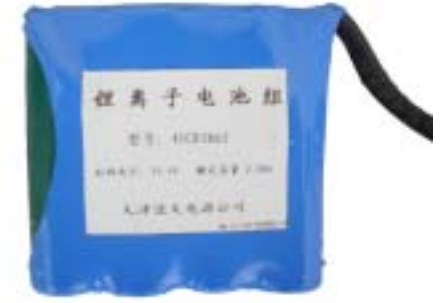
41CR1865锂离子电池组充放电曲线